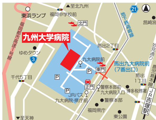
外来診療棟にお越しの際は、東門からのアプローチが便利です。お車の方は、正門からのみの入構です