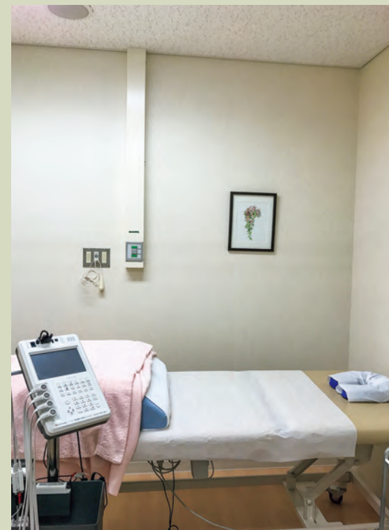
外来診療棟4階東第2リンパ浮腫外来