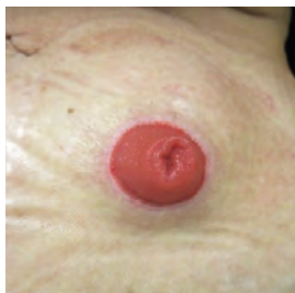
トラブルのないストーマ

ストーマとは人工肛門のことです。 さまざまな疾患で肛門や膀胱の摘出を行った場合に造られます。